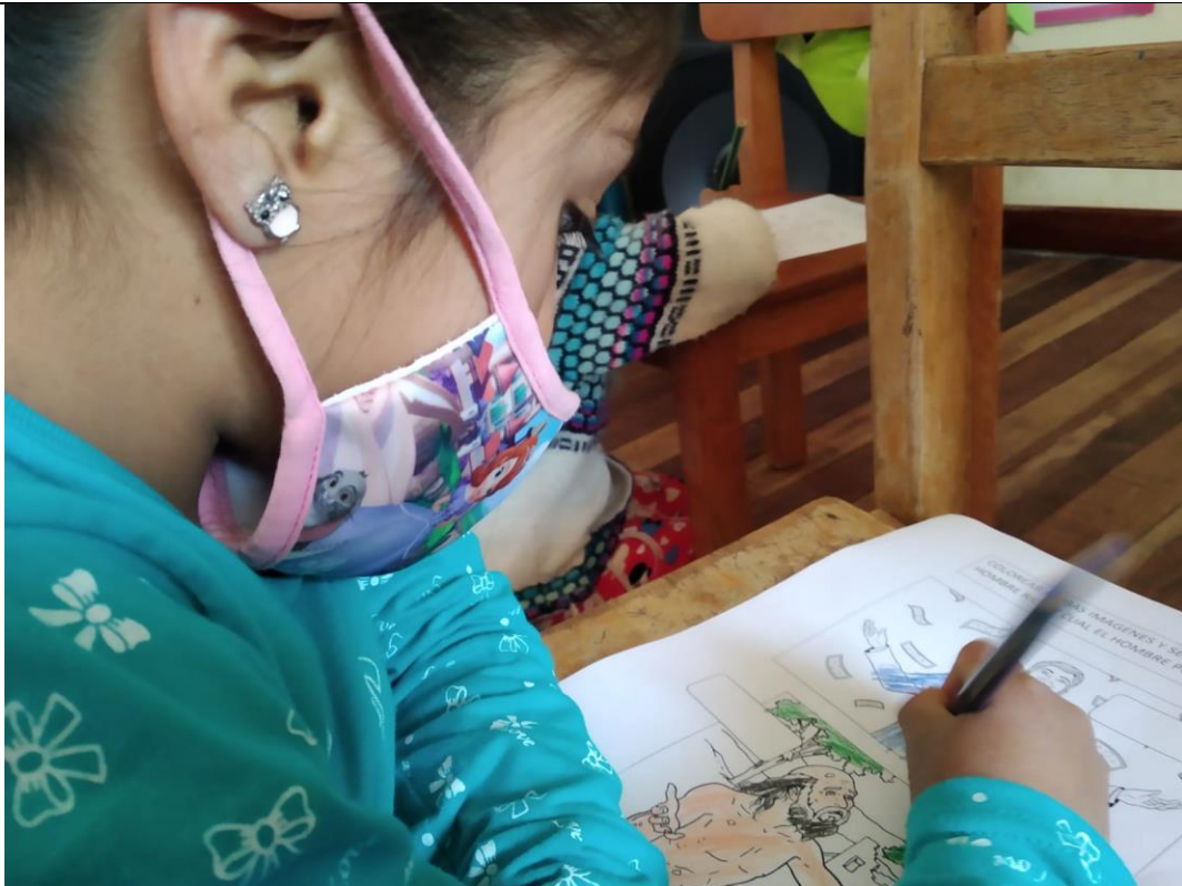
FOTOGRAFIA N° 05: NIÑA PARTICIPANTE COMPLETANDO RETO DE FICHA DE TRABAJO