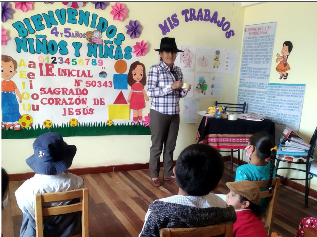
FOTOGRAFIA N° 08: INVESTIGADORA EN PLENO DESARROLLO DE CLASES