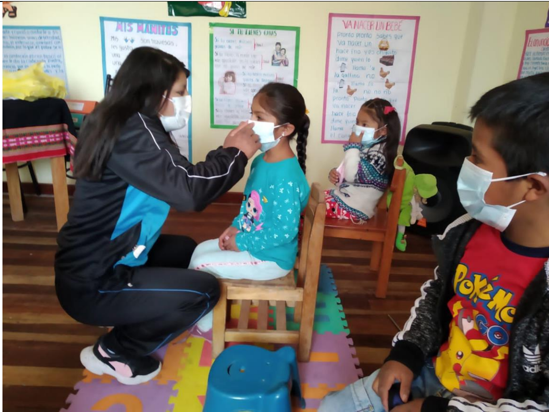
FOTOGRAFIA N° 03: DEMOSTRACIÓN EN VIVO DEL CORRECTO USO DE LA MASCARILLA PARA PREVENIR EL COVID 19