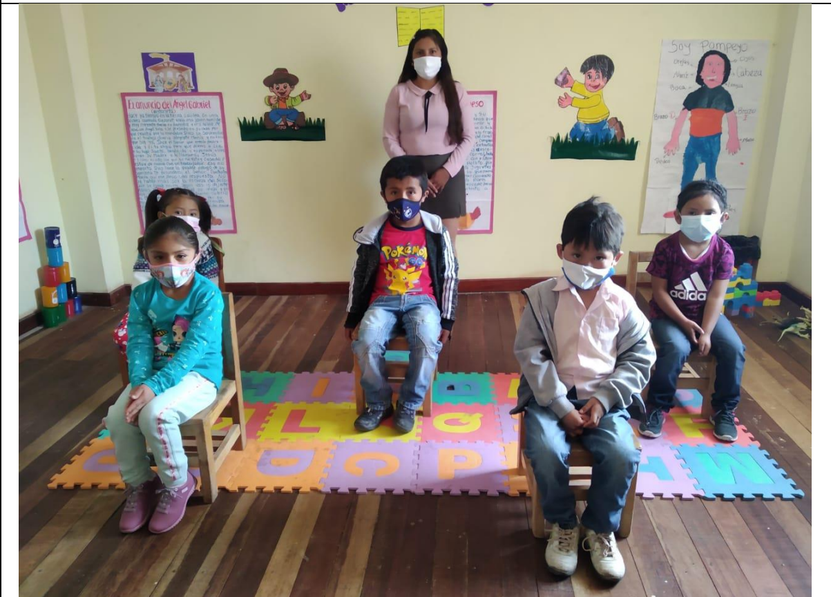
FOTOGRAFIA N° 10: PLENO DE LOS NIÑOS COLABORADORES EN LA APLICACIÓN DE NUESTRO POSTULADO EN LA TESIS.