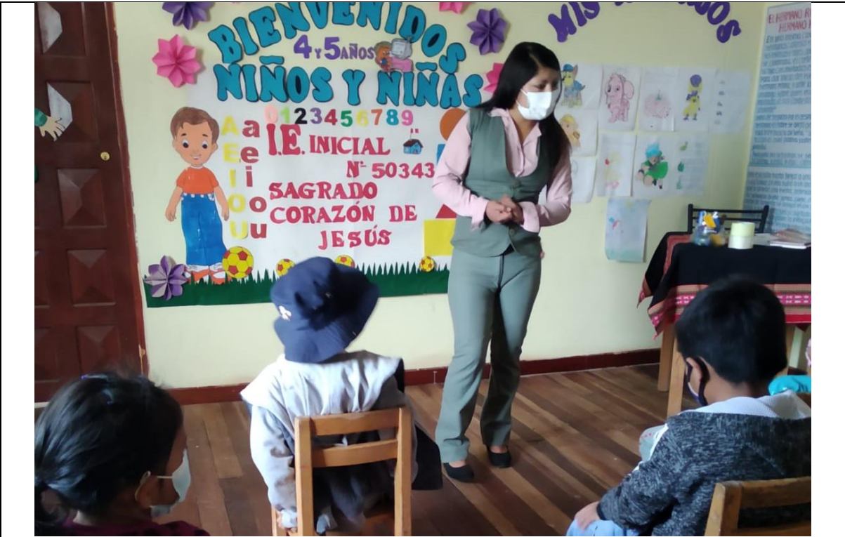
FOTOGRAFIA N° 09: INVESTIGADORA DESARROLLANDO LOS ACUERDOS DE CONVIVENCIA.