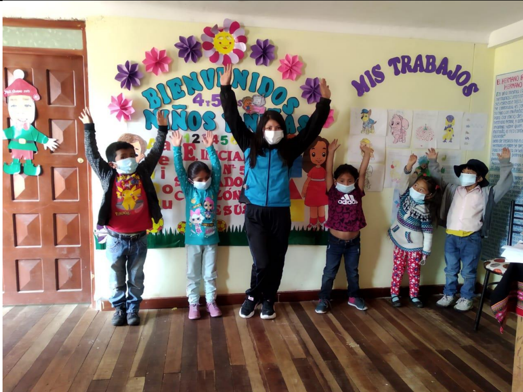
FOTOGRAFIA N° 11: GRUPO DE TRABAJO EN PLENA DINAMICA PARA ACTIVAR NUESTRA ATENCION