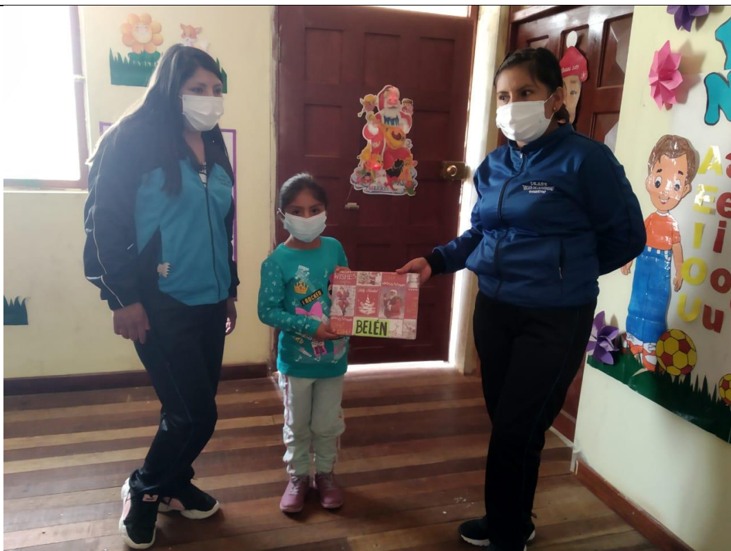
FOTOGRAFIA N° 13: SE MUESTRA CUADERNO DE TRABAJO DE UNA DE LAS PARTICIPANTES