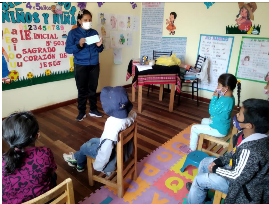
FOTOGRAFIA N° 02: ENSEÑANDO EL CORRECTO USO DEL BARBIJO EN CLASES