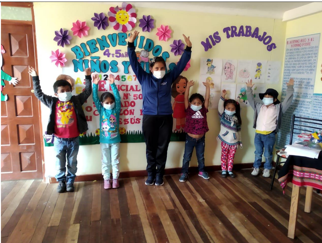
FOTOGRAFIA N° 12: SE CONTINUA PARTICIPANDO CON LOS NIÑOS EN LA DINAMICA DE GRUPO