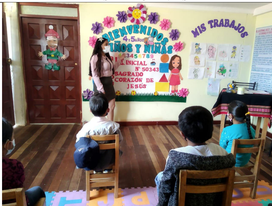
FOTOGRAFIA N° 14: SE AMBIENTÓ Y ADECUÓ EL ESPACIO PARA UN BUEN DESARROLLO DE LAS ACTIVIDADES.