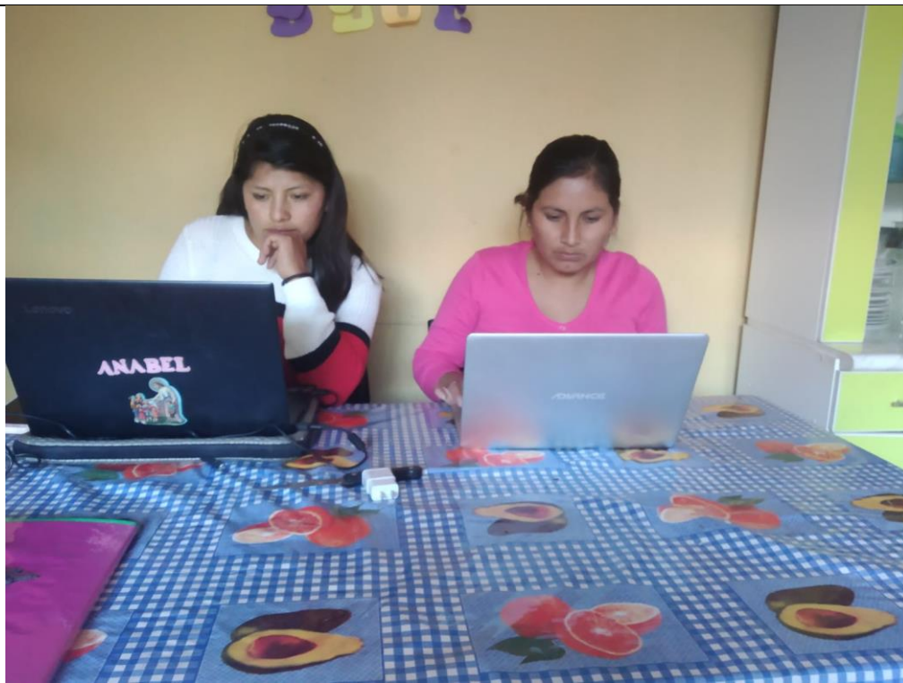
FOTOGRAFIA 01 : INVESTIGADORAS AVANZANDO LA TESIS