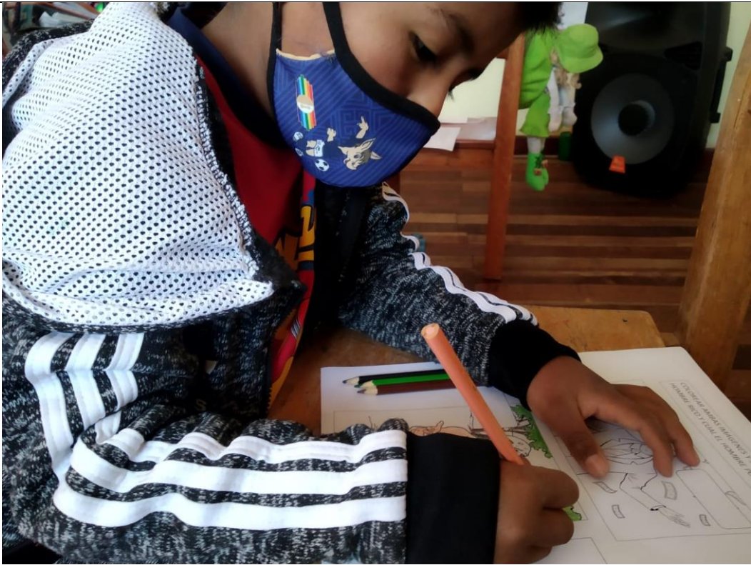
FOTOGRAFIA N° 07: NIÑO PARTICIPANTE CONCENTRADO EN EL DESARROLLO DE SU FICHA DE TRABAJO