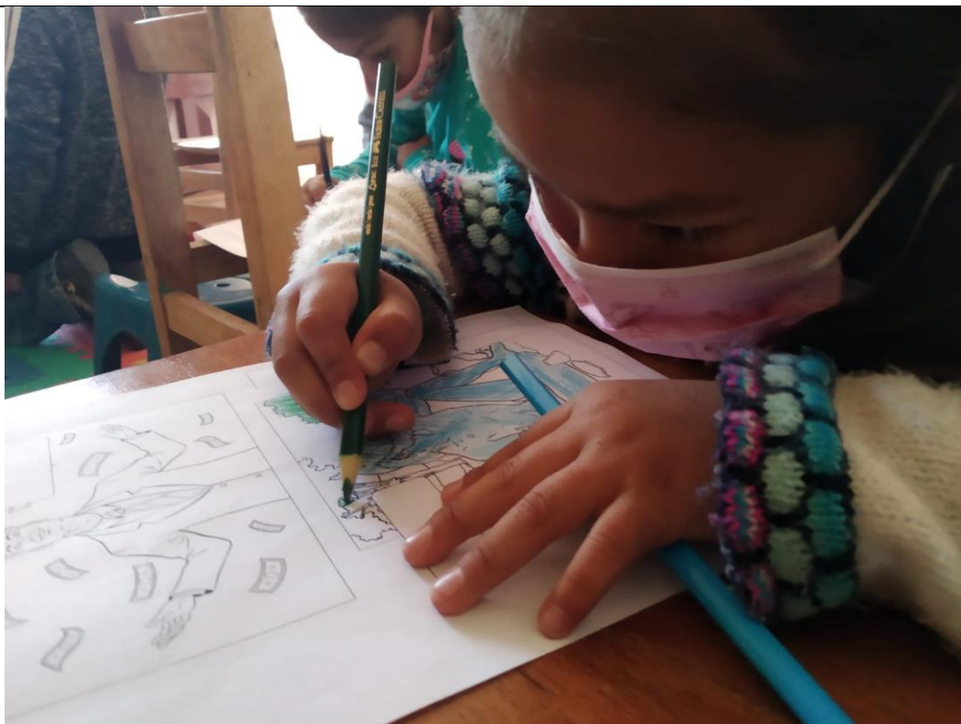
FOTOGRAFIA N° 06: OTRA NIÑA COMPLETANDO RETO PERSONAL DE LA FICHA DE TRABAJO