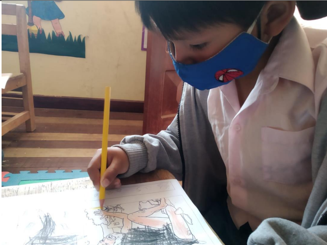
FOTOGRAFIA N° 04: NIÑO PARTICIPANTE DESARROLLANDO TRABAJO DE PINTADO DE FICHAS